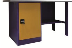
ВП-2; ВП-2/1.2; ВП-2/1.6