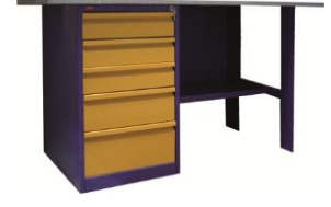
ВП-3; ВП-3/1.2; ВП-3/1.6